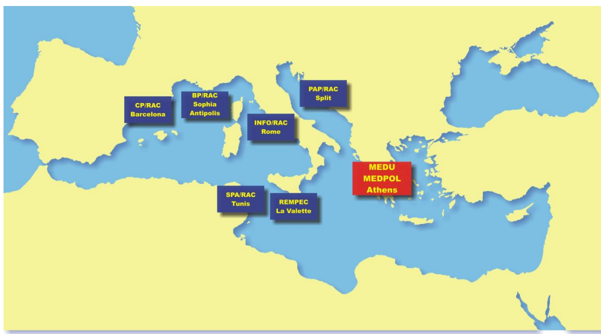
Slika 2. Sastavnice UNEP/MAP-a.